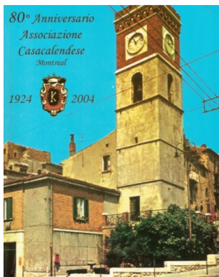
La torre dell'Orologio a Casacalenda.

Quest'anno la nostra associazione festeggia l'85° anniversario di fondazione. Nel 18° secolo i Casacalendesi, assetati di fortuna in cerca di un pezzo di pane come tanti altri Italiani, emigrano attraverso il mondo. Fortunati quelli diretti in Canada due volte, prima per essere arrivati a destinazione, e poi per aver raggiunto una terra ricca. E benché è stata dura la vita anche per loro, diciamo chiaramente in questa terra chi è stato fortunato ed ha lavorato duro ha potuto realizzare qualche sogno tenendo alto il prestigio della nostra bella Italia a differenza di tanti altri emigranti, sbarcati in stati che con tutti gli sforzi non hanno potuto realizzare la stessa cosa perché paesi poveri per natura. Come si dice: non può divenire ricco un marinaio se lavora con un povero pescatore.